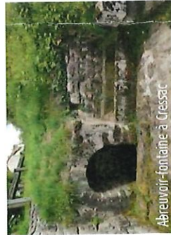
Abreuvoir-fontaine à Cressac

L'étang, d'une superficie de plus de 6 ha, est traversé par le Rivalier. Il est réservé à la pêche. (Source commune)