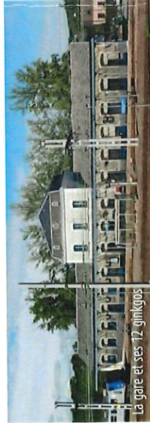
La gare et ses 12 ginkgos

Contempler de l'autre côté des voies, la gare et son alignement unique de ginkgos biloba nommé aussi "arbre aux quarante écus", "abricotier d'argent" ou "Ginkgo". C'est une espèce d'arbres, seule représentante actuelle de la famille des Ginkgoaceae et la plus ancienne famille d'arbres connue, puisqu'elle serait apparue il y a plus de 270 millions d'années. Elle existait déjà une quarantaine de millions d'années avant l'apparition des dinosaures. (Source Wikipedia)