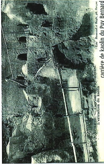
L'exploitation des carrières de kaolin commence en 1812 dans les monts d'Ambazac. L'extraction du kaolin L'Éclair Beaumont et Rogée, pub. Rougier