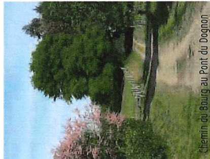
Chemin du Bourg au Pont du Dognon