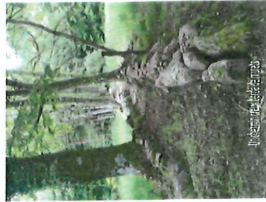
Le bourg de Jabreilles