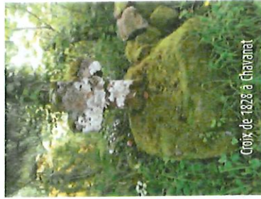
Croix de 1628 à Chavanat

11 A la route, tourner à droite, puis au carrefour suivant, remonter la RD203. Dans le virage en épingle, suivre à gauche le beau chemin qui redescend vers le bourg de Jabreilles et l'église. En bas des escaliers, face à l'église, tourner à gauche et rejoindre le cimetière.